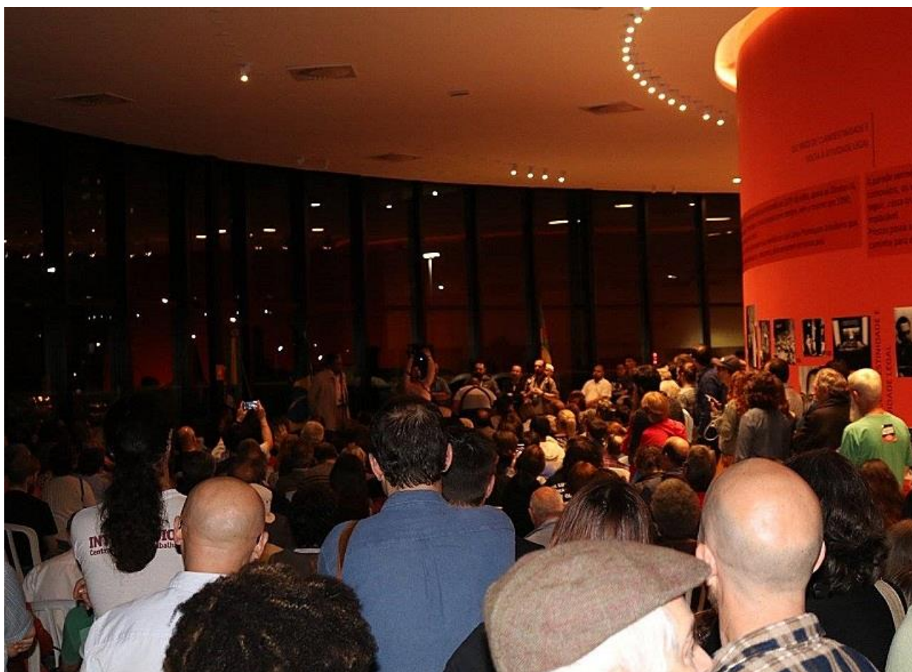
Registro fotográfico da celebração de inauguração do Memorial em outubro de 2017.